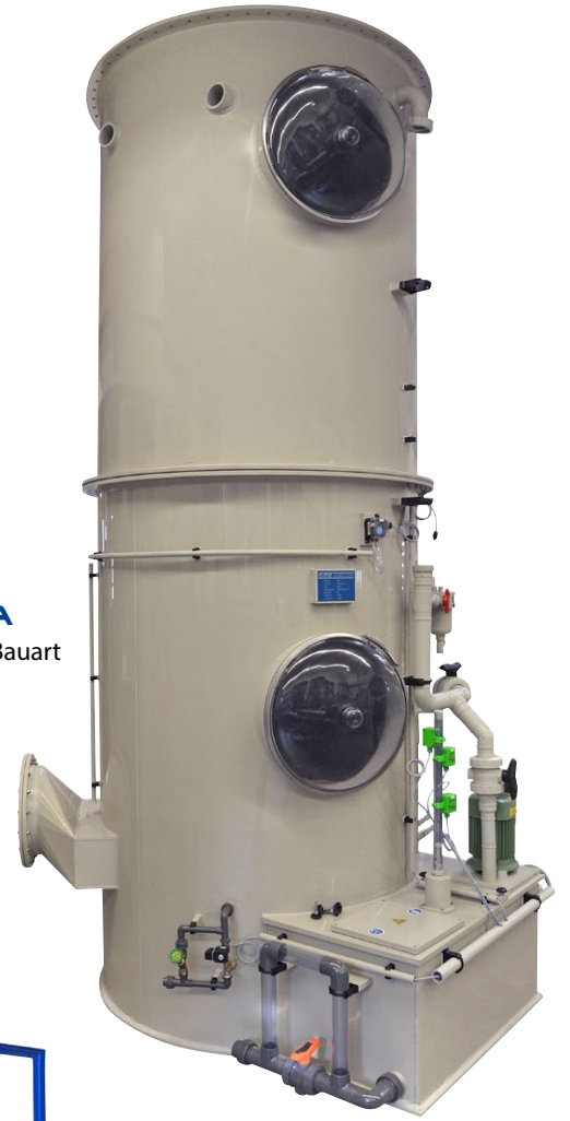
MAA stehende Bauart